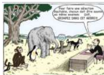
EGALITE DES CHANCES

Or, ce sont les situations qui sont handicapantes. Si je suis un poisson, je serai handicapé pour grimper à l'arbre.